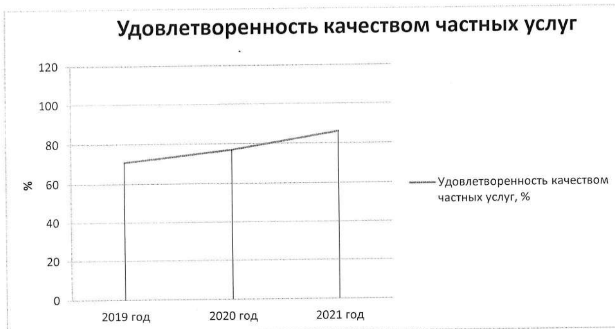
Рисунок 4 – удовлетворенность качеством частных услуг по годам

Оценку рынку дали 101 респондент – потребителей услуг. Оценим динамику ответов за период 2019-2021 годы.