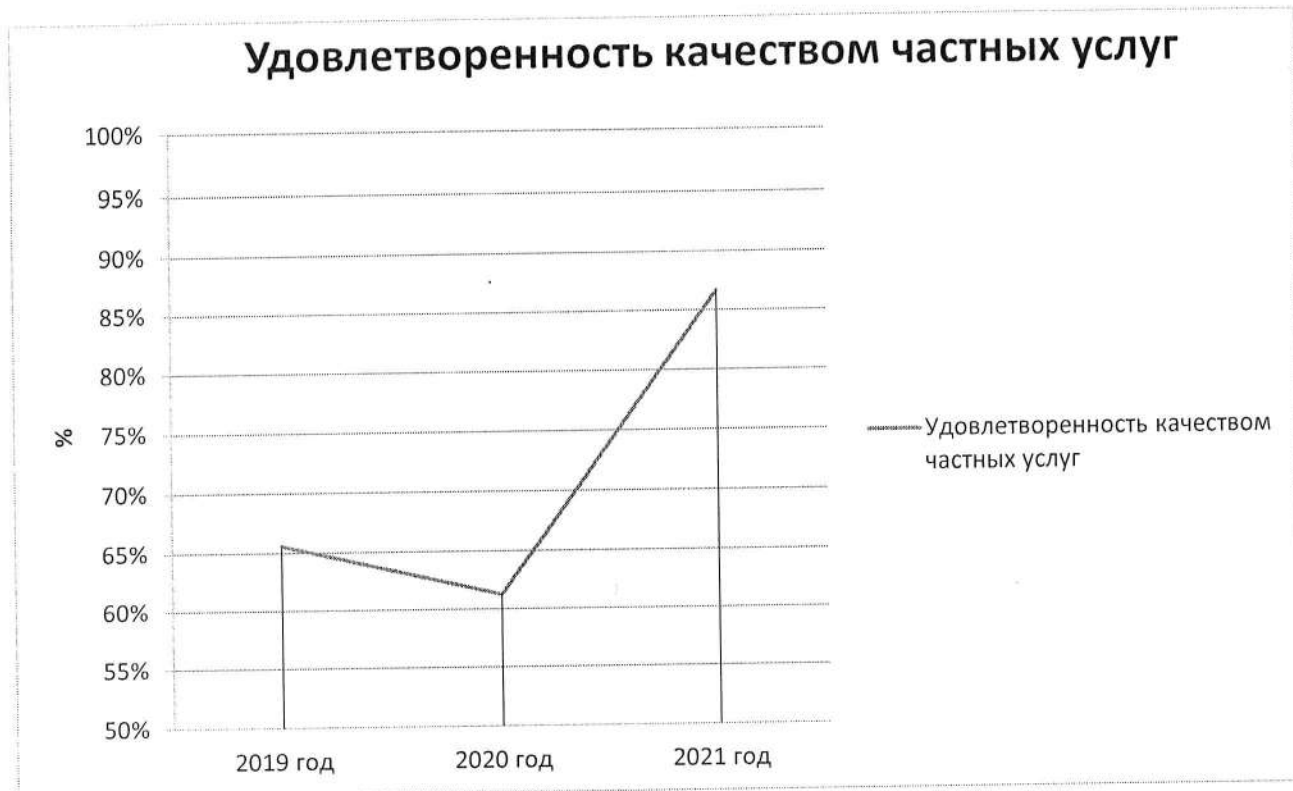
Рисунок 3 – удовлетворенность качеством частных услуг по годам

По итогам ежегодного опроса оценка качества услуг УК увеличилась на 25%, что является следствием смены части управляющих компаний в МКД за последний период ввиду передачи жилфонда из организаций с низким рейтингом в действующие на рынке УК. При стабильной ситуации на рынке в следующем году, оценка качества услуг должна быть более 80%.